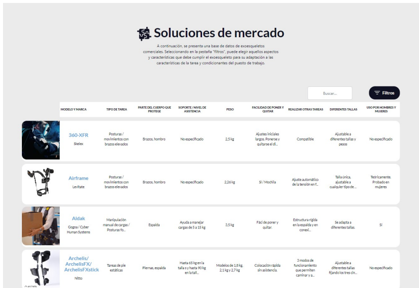
Figura 10. Ventana de Soluciones de mercado

En la ventana de este apartado puede encontrar los siguientes apartados (Figura 10):